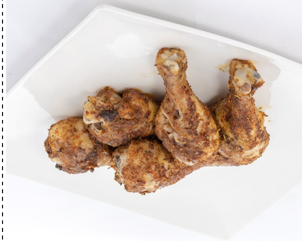
32. pieczony kurczak