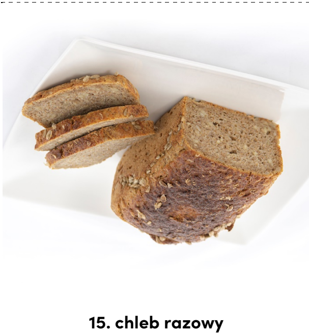
15. chleb razowy