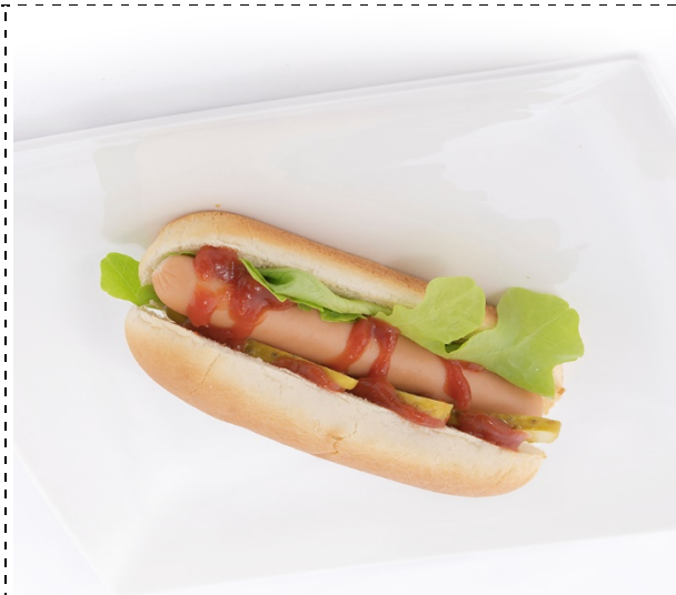
47. hot dog