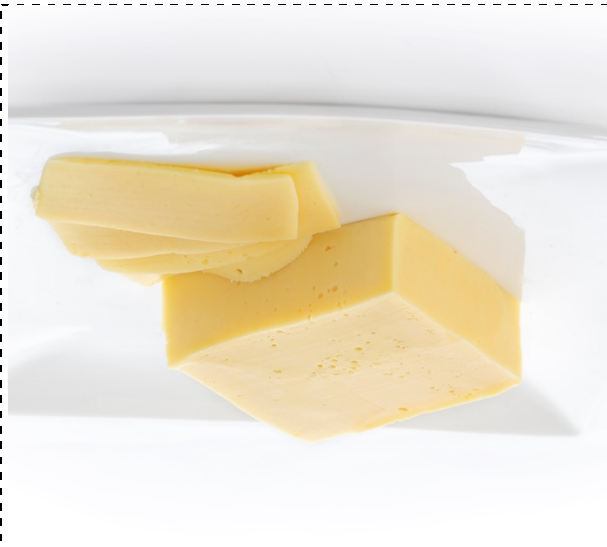
40. ser żółty