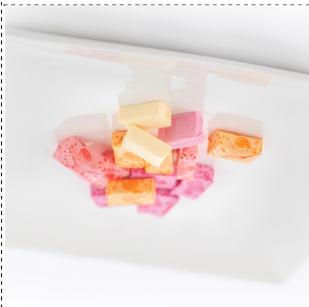
24. gummy do żucia