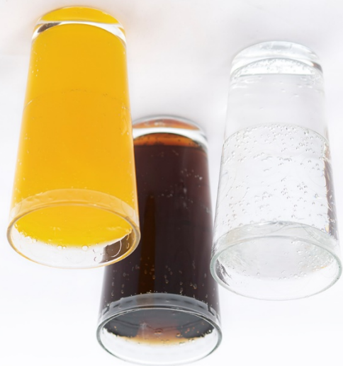
27. napoje gazowane