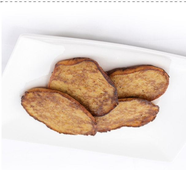
36. placki ziemniaczane