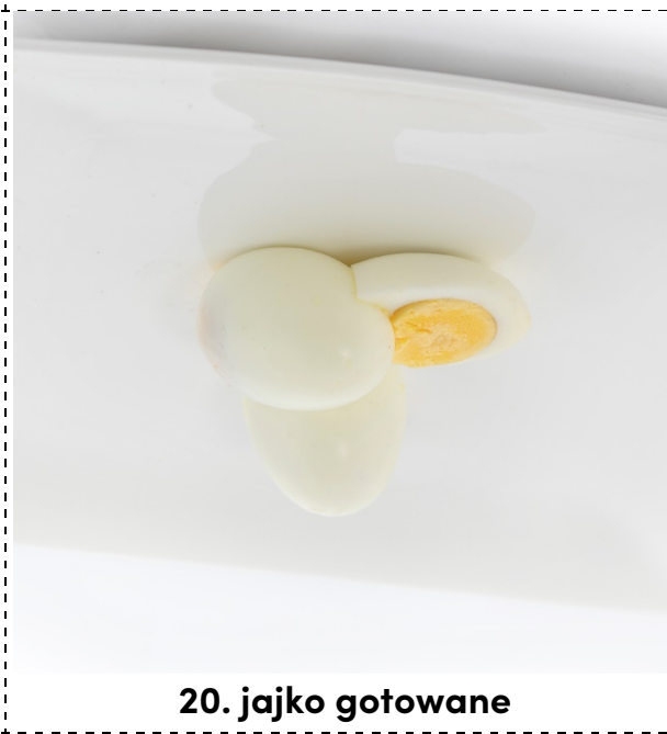
20. jajko gotowane